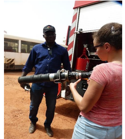
Explication sur l'utilisation du matériel.

Quelques petites égratignures ont été constatées, suite au voyage en bateau quelque peu mouvementé. L'agent communal a démarré avec facilité les 2 engins, fier de montrer l'entretien réalisé au quotidien par les garagistes.