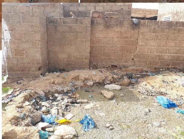
Latrine de l'école maternelle (en haut à droite).