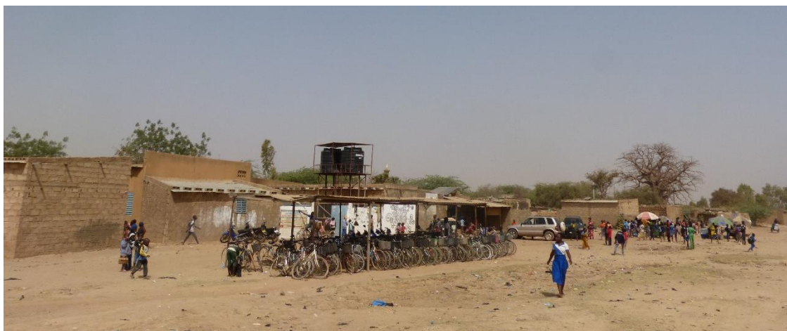
Entrée du Groupe Scolaire sans mur d'enceinte.