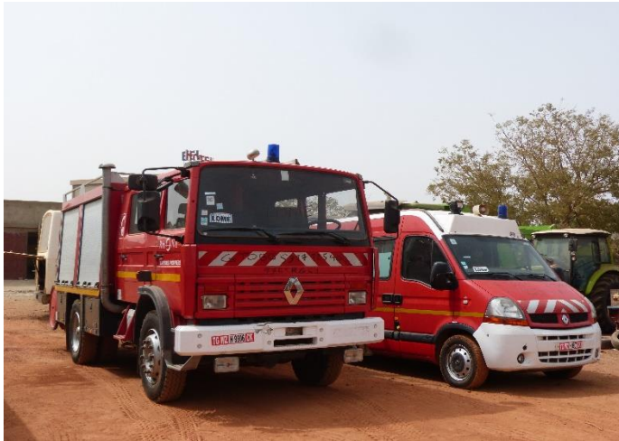
Fourgon et ambulance envoyés fin 2019.

Nous avons pu nous y rendre pour les voir accompagnées par le Sergent-Chef ZONGO de la BNSP.