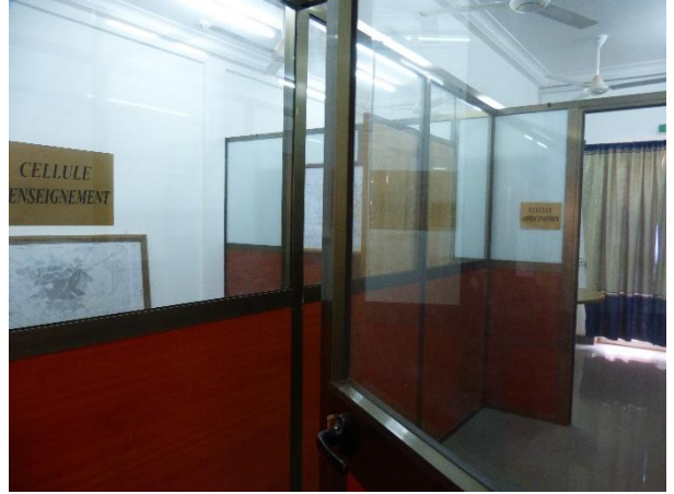
Salles de gestion de crise afin de réaliser les formations d'officiers au plus proche de la réalité.