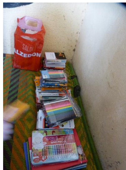
Don de fournitures scolaires.

Ce moment d'échange a également permis à Vincent de nous fournir les factures des achats de médicaments réalisés durant l'année grâce aux dons de Faso Feu.