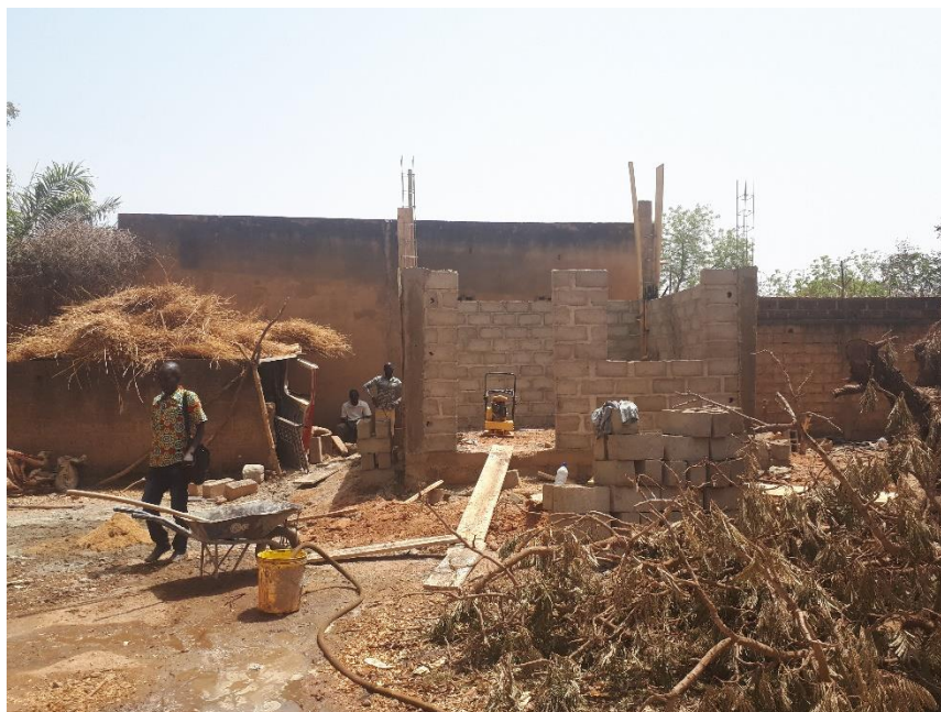
Construction du local compresseur.

Avec l'autorisation de l'Etat-Major nous avons pu visiter le chantier basé à la 8 ème compagnie.