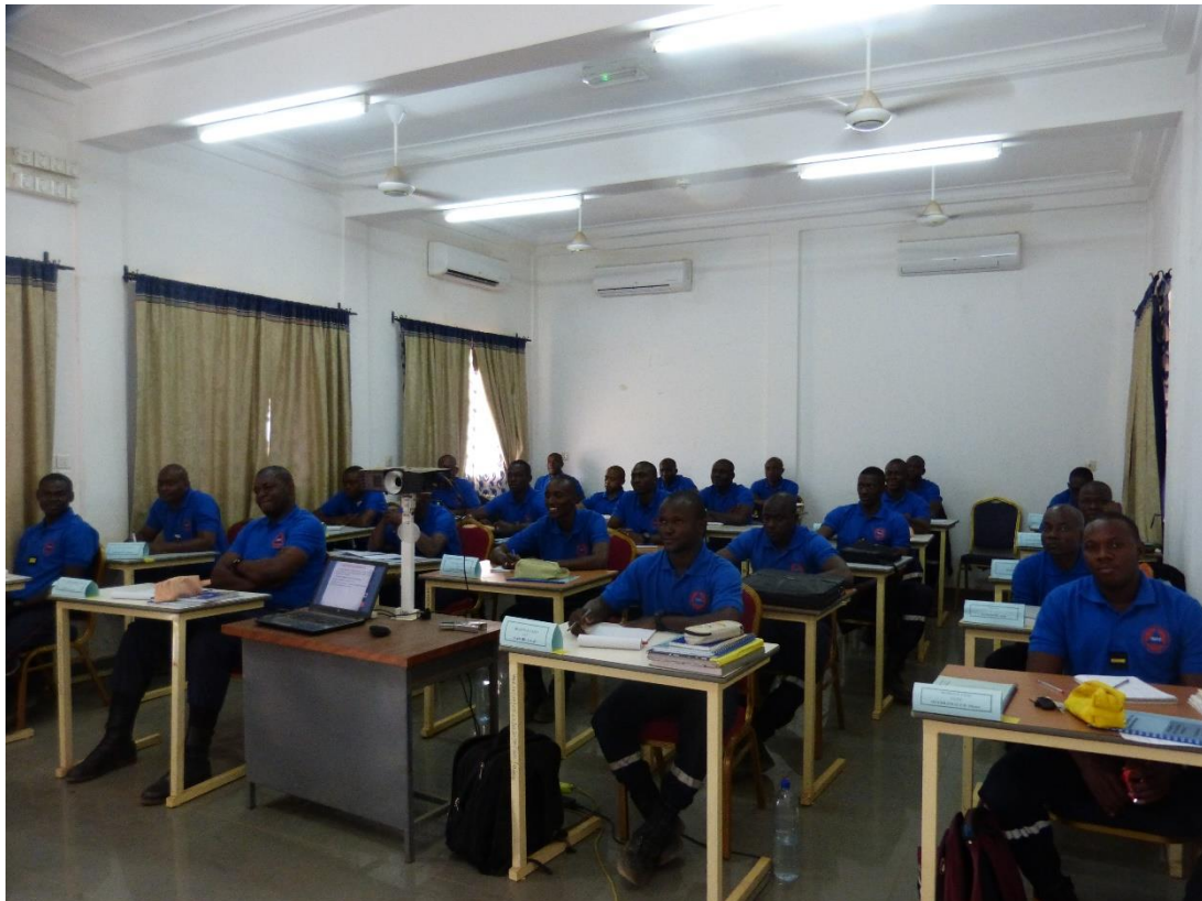
Formation initiale de Lieutenant, regroupant 16 nationalités différentes.