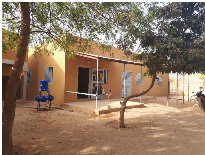
Bureau des surveillants