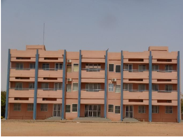
Bâtiment de l'ISEPC regroupant l'administration et les salles de formation.

Nous avons également été reçus par le Commandant GROSBOIS de la BSPP avec qui nous avons beaucoup échangé sur l'organisation des stages mais aussi le travail de la coopération. Les moyens envoyés et les formations aux sapeurs-pompiers burkinabé doivent vraiment être adaptés.