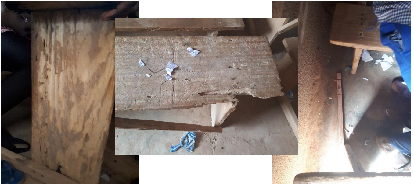
Bancs rongés par les termites ou abimés par l'usure.