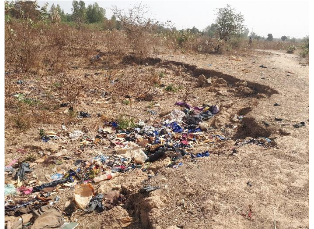
Abords du Groupe Scolaire érodés lors de la saison des pluies.