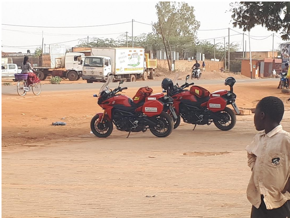
Motos de la BNSP le long d'un axe fréquenté

Le risque routier a également été étudié par la BNSP car des motos ont été achetées afin d'être prépositionnées le long des accès très fréquentés. Cela permet une plus grande réactivité des secours aux heures de pointes.