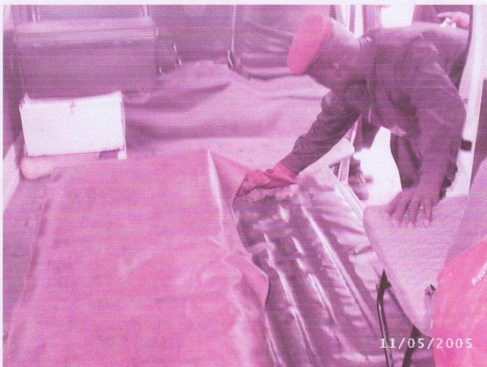
Intérieur de la cellule de l'ambulance