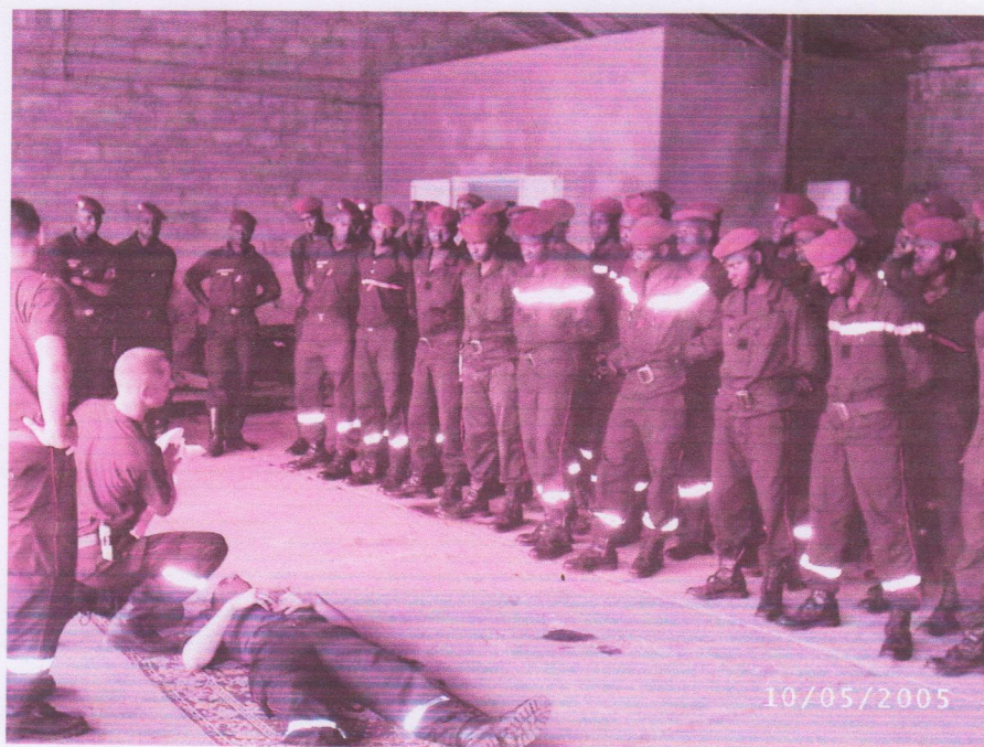
Formation sur le matériel acheminé (ici, le collier cervical)