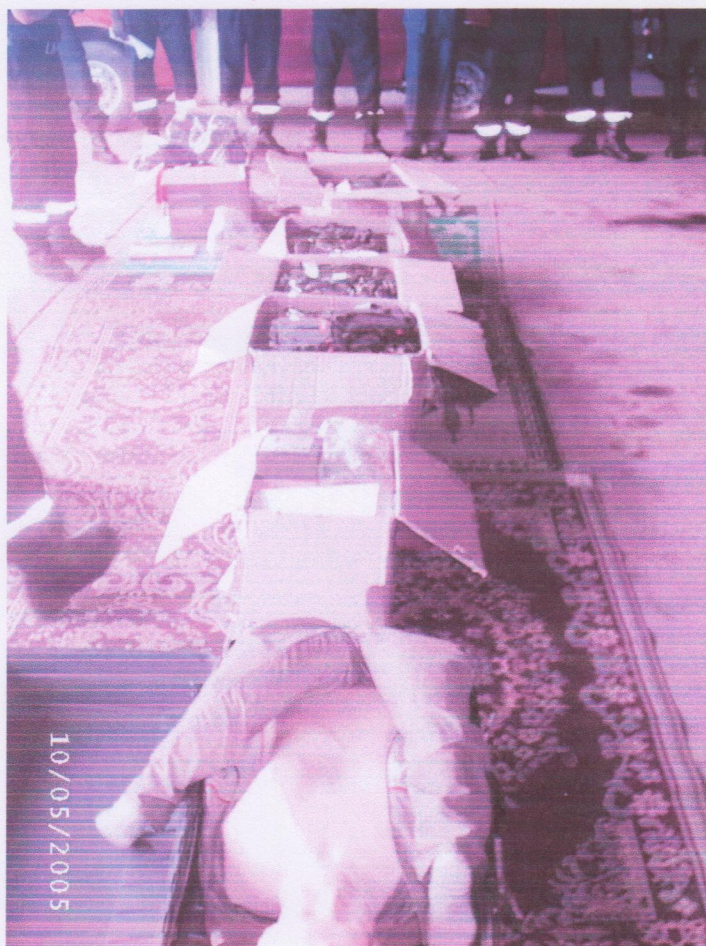
Le 11 mai : cérémonie remise officielle du matériel acheminé par Faso Feu