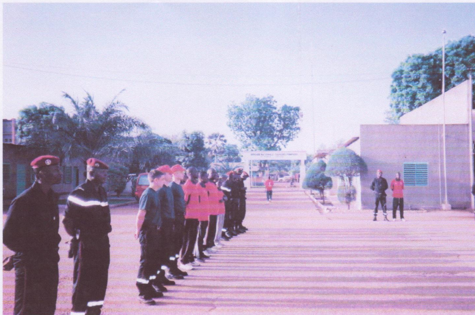
Prise de garde à 7 heures, rassemblement et répartition des hommes sur les engins.

Enfin cette journée a laissé le temps d'étudier le traitement de l'alerte et surtout d'entamer un bilan précis sur le matériel