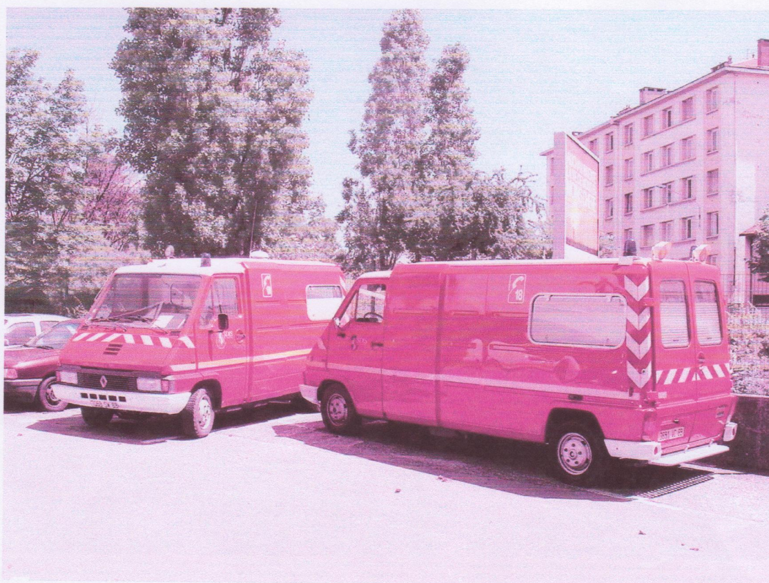
Les 2 ambulances de Faso Feu pour 2006