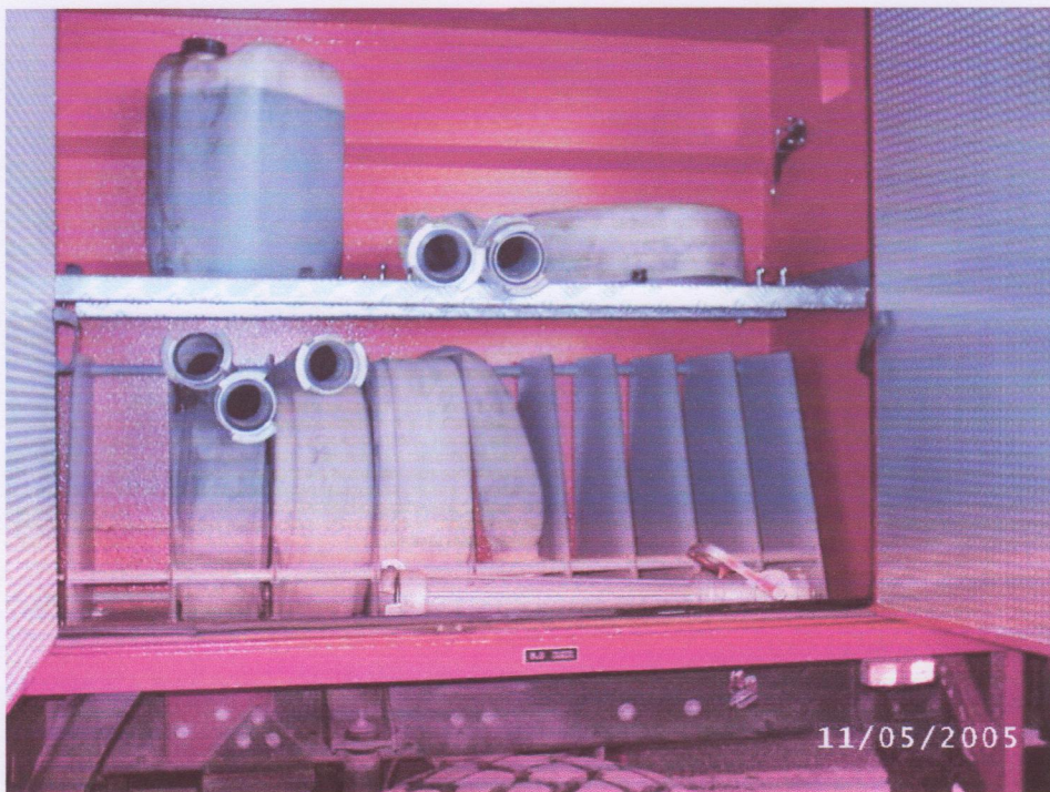
Coffre de l'unique engin de lutte contre l'incendie