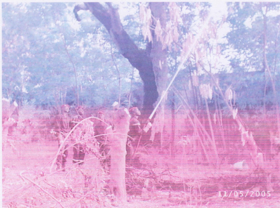
Un feu d'arbre d'origine accidentelle, la lance du dévidoir tournant en manœuvre.