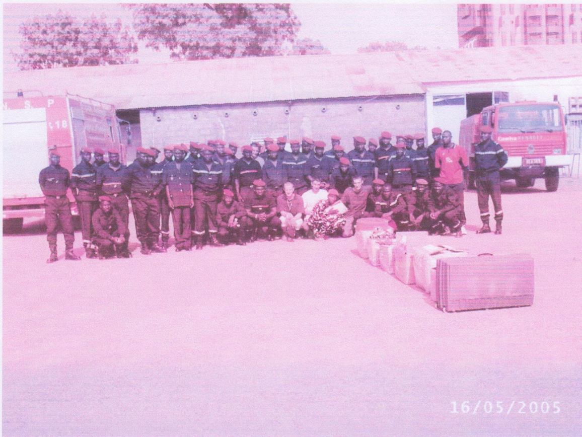
Les membres de Faso Feu en compagnie du chef de centre, des sous-officiers et des hommes du rang.